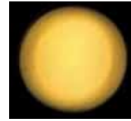
Life Light CoEnzym Q10

Eine mikroskopische Untersuchung mit einer Vergrößerung von 200X zeigt, dass Life Light CoEnzym Q10 keinerlei Kristalle aufweist, während eine Paste aus CoEnzym Q10-Pulver und Sojaöl über eine kristalline Struktur verfügt